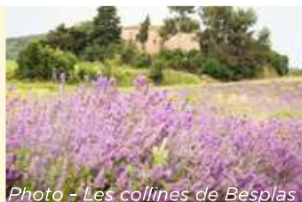
Photo - Les collines de Besplas

Il se conserve facilement 3 à 4 jours dans une boîte hermétique, idéal pour accompagner une glace ou vos boissons chaudes ( infusions aux plantes aromatiques- Pays Cathare ).