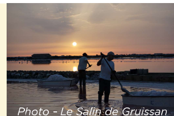
Photo - Le Salin de Gruissan